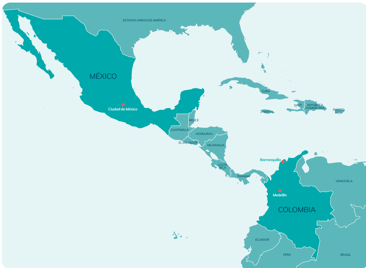
Figura 2. Lugares del proyecto 4Mi Cities

4Mi Cities tiene como objetivo generar evidencia para que las respuestas locales a la migración mixta en las ciudades estén mejor informadas y para crear un caso sólido para marcos legales, fiscales y de políticas nacionales e internacionales que permitan a las ciudades brindar adecuadamente los servicios necesarios a las poblaciones de personas refugiadas y migrantes. Los gobiernos de las ciudades que participan en el proyecto, así como los actores humanitarios y de desarrollo, utilizarán los datos recolectados para mejorar sus políticas y respuestas migratorias actuales a nivel de ciudad.