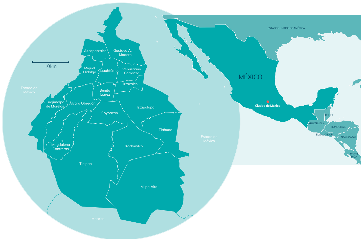
Figura 1. Mapa de Ciudad de México